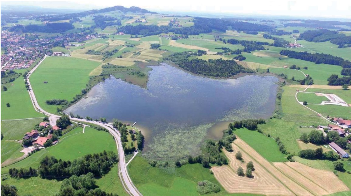
Einfach schön - unser Vereinsgewässer.

Herzlichen Dank an alle Helfer und Gäste, die zum Erfolg dieses Festes beigetragen haben!