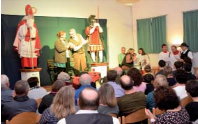
Die Akteure bei der Premiere 2018

Im Programm "Ja mei!" geht es um Alltagssituationen und Rückblicke. Am Freitag, 22.März und Samstag, 23.März, jeweils um 20 Uhr würden wir uns daher über viele Zuhörer freuen.