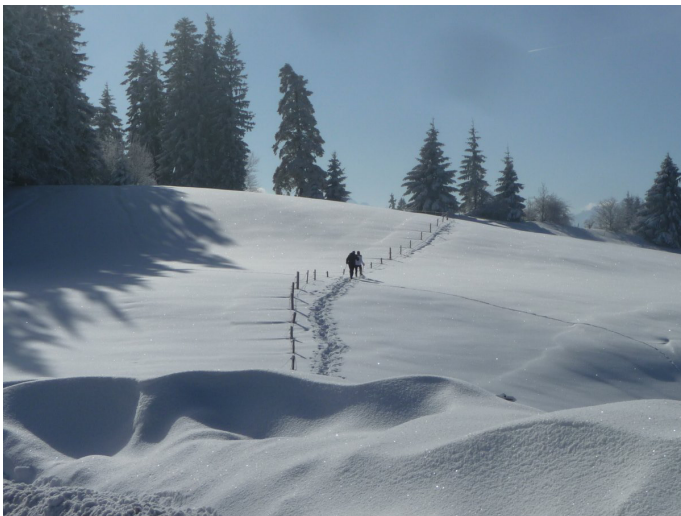
Auf dem Auerberg