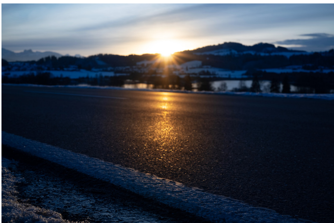
Oberhalb des Haslacher Sees