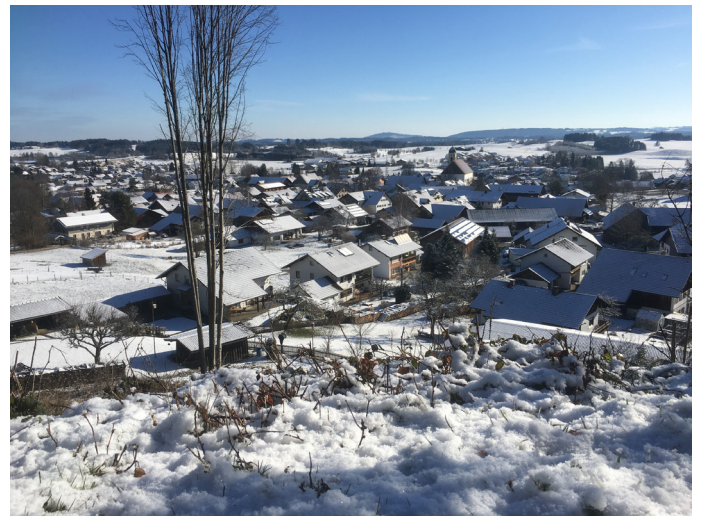
Blick von der ehemaligen Burg