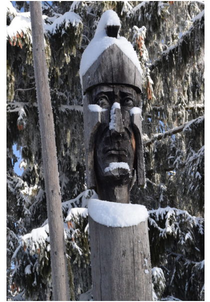
Römer am Auerberg