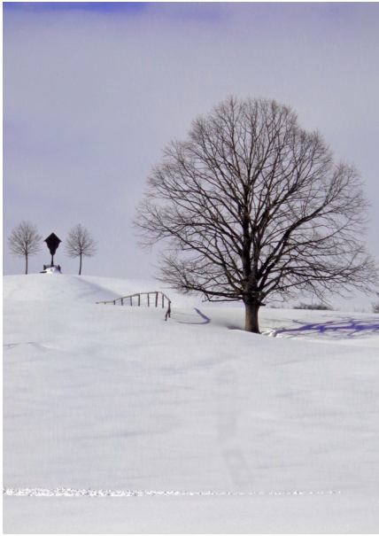
Nähe Brunnhof

Das Kath. Landvolk hatte im letzten Jahr um Zusendung von Fotos für einen Kalender anlässlich der 800-Jahr-Feier gebeten. Hier nun der 2. Teil der Landschaftsbilder. Wir bedanken uns fürs Mitmachen!