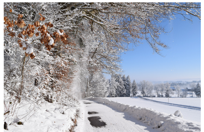
Nähe Schlögelsberg